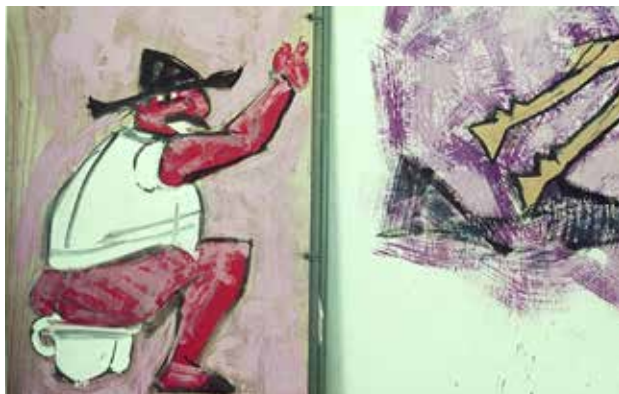
איור 17 | פרט מתוך ציור קיר בגלריה המרכזית בעין הוד. צייר: מרסל ינקו, שנות ה־60