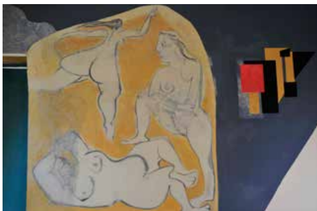
איור 2 | קיר ציורי הנשים, 2010.

שרידי הציורים הראשונים שנחשפו לא אפשרו לקבל תמונה כוללת שלהם. בזמן ערכנו מחקר היסטורי כדי למצוא תיעוד שיסייע בידינו לשמר את הסטודיו של האמן ולשחזר אותו. סרט של יהודה טרמו "עין הוד" שהופק ב־1959 (טרמו 1959), סיפק לנו את המידע המבוקש. בקטע המתייחס למרסל ינקו בסטודיו, דקה 7:48 בסרט, סוקרת המצלמה את קירותיו של החלל המרכזי. בסרט נראה בבירור חיפוי של הקירות בצבע כחול כהה, שייצר צללית בהירה של דמות ציפור־אדם גדולה על הקיר המזרחי, וכמין קשתות או גלים על הקיר הדרומי, על הקיר הצפוני מתחת לחלון, ועל הקיר המערבי והמזרחי בפינת המגורים. צבע העיטור ב־1959 היה כחול כהה. מאוחר יותר, בראשית שנות ה־60 (על פי תצלומים בשחור לבן), נוספה דוגמת כתמים בגוון בהיר על הצבע הכחול. במהלך השחזור התגלה בבירור החיפוי הכחול, אך לא נמצא כל שריד לדוגמה ולצבעה. המשטחים הגובלים בעיטור הכחול היו צבועים בגוון קרם בהיר, ועל רובם היו ציורים. על הקיר המזרחי בפינת המגורים נמצא ציור של שלוש נשים עירומות - האחת שוכבת, השנייה מוצגת פשוטת רגליים, והשלישית מצוירת מאחור (איור 2).