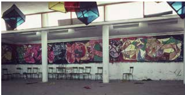
איור 15 | ציורי קיר בגלריה המרכזית בעין הוד, שנות ה־60 של המאה העשרים