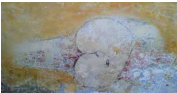
איור 6 | הציור "ראשי־שבן" בסטודיו של ינקו, 2012.

הנסמך אל הקשת (איור 5). מעברה השני של הקשת התגלה ציור דמוי "ראשי־שבן" (איור 6). בשלב זה התחיל תהליך חשיפת הציורים במבואה. על שני הקירות הפנימיים, שנצבעו בירקרק בחלקם העליון ובצהוב־אוקר בחלקם התחתון, התגלו ציורים במצב השתמרות טוב. על הקיר הצפוני, בצד אחד של הדלת מצוירת מעין שבשבת ובצד השני, שני כלבים המרחחים זה את ישבן רעהו (איור 7). על הקיר הניצב