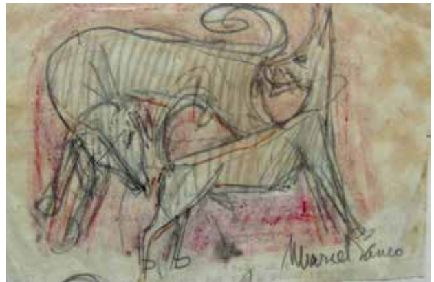
איור 13 | מרסל ינקו, שני כלבים מרחרחים, שנות ה־50 של המאה העשרים | באדיבות אוסף איצ'ה ממבוש, עין הוד. צילום: רעיה זומר־טל