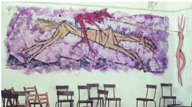
איור 16 | דון קישוט, ציור קיר בגלריה המרכזית בעין הוד. צייר: מרסל ינקו, שנות ה־60