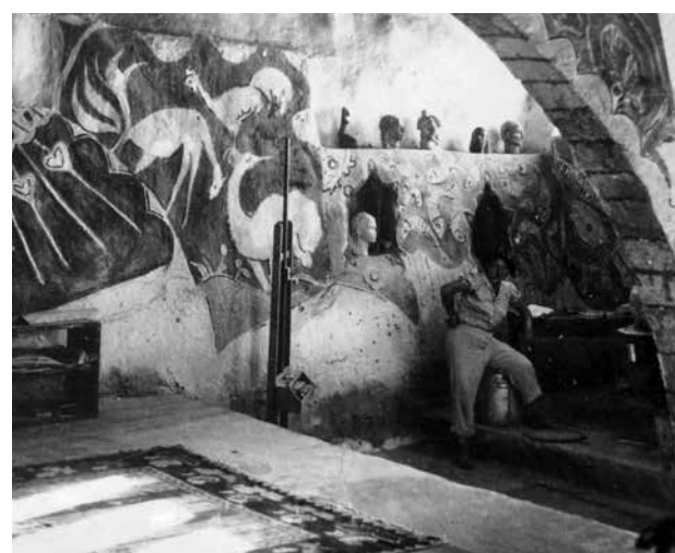
איור 11 | גרטרוד קראוס בסטודיו, שנות ה־50 של המאה העשרים

בבית כפי שנראה גם בתצלומים הם מעשי ידי מוקדי? לגבי "הבית של ינקו" נאמר: "יקושט על ידו ועל ידי מידי [כך במקור] - מהמאה ה־16 ועד היום הזה". לנשף השני בשנת 1956 הופקה חוברת ובה טקסט קצר על הכפר, רפרודוקציות של מספר עבודות, ומפה של הכפר עם מקרא (איור 12). בית מס' 12 הוא בית ינקו, מכונה "בית דאדא". מכאן, אפשר אולי לשער, כי דיוקנאות אבות התנועה - צארה, ארפופיקביה, שצוירו בחדר הקדמי בבית ינקו נעשו בשנה זו, 1956. בעיתון "דבר" מ־1 במרס 1956 נמצא תיאור של ההכנות לנשף וקישוט 19 חדרים בבתי הכפר: "ע"י 'כיסוי' קירותיהם בציורי הווי... החדרים השונים, ששימשו פעם חדרי מגורים לפלחים, הפכו במחולם של האמנים לחדרי פאר ותצוגה... אולם זכרון לתנועה הדדאיסטית ועוד..." (דבר 1.3.56: 2).