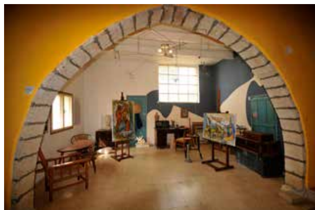
איור 1 | הסטודיו המשוחזר של מרסל ינקו, 2010.