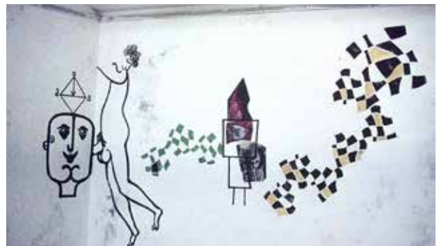
איור 14 | ז'אן דויד, ציור קיר בגלריה המרכזית של עין הוד, 1964

באוספו של איצ'ה ממבוש, ידידו הטוב של ינקו ושותפו להקמת עין הוד, קיים רישום של שני הכלבים המרחרחים זה את ישבן רעהו (איור 13). איצ'ה נהג לספר כי רישומים אלה היו דרכו של ינקו לפרוק את תסכולו מחילוקי הדעות והוויכוחים בישיבות הוועד. פני החיות דמו פעמים רבות לדיוקנאות של החברים... ינקו שמח גם לשלבם על קירות ביתו. אף שהציור אינו מתוארך בוודאות, מאחר שהחיפוי הירוק־אוקר קיים גם בקיר זה, ייתכן ששני הקירות צוירו ב־1956.