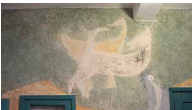
איור 7 | ציור הכלבים במבואה, 2012 | צילום: גלית בן עמי

הנסמך אל הקשת (איור 5). מעברה השני של הקשת התגלה ציור דמוי "ראשי־שבן" (איור 6). בשלב זה התחיל תהליך חשיפת הציורים במבואה. על שני הקירות הפנימיים, שנצבעו בירקרק בחלקם העליון ובצהוב־אוקר בחלקם התחתון, התגלו ציורים במצב השתמרות טוב. על הקיר הצפוני, בצד אחד של הדלת מצוירת מעין שבשבת ובצד השני, שני כלבים המרחחים זה את ישבן רעהו (איור 7). על הקיר הניצב