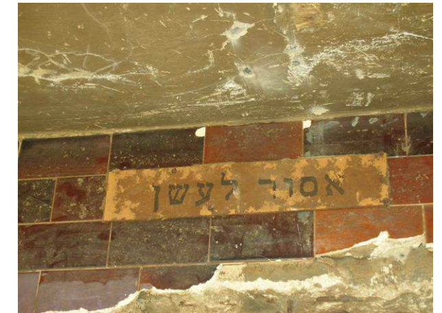
כניסה לביתן איטלקי - חיפוי קרמיקה צבעונית 'אסור לעשן'