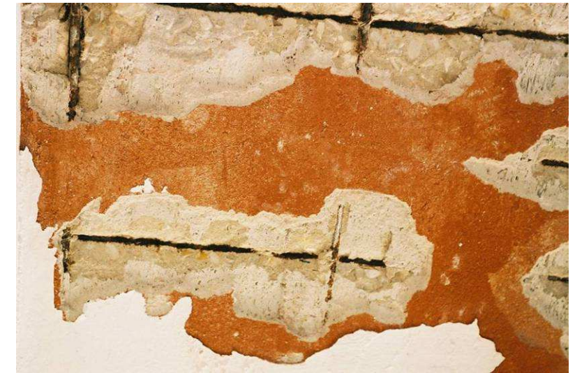
ארוזיה הפוגעת במוטות הברזל וגורמת להתפוררות הבטון