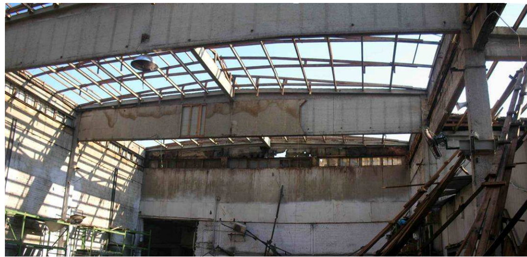
10. קונסטרוקציה הגג הביתן הזר (חלל מרכזי)