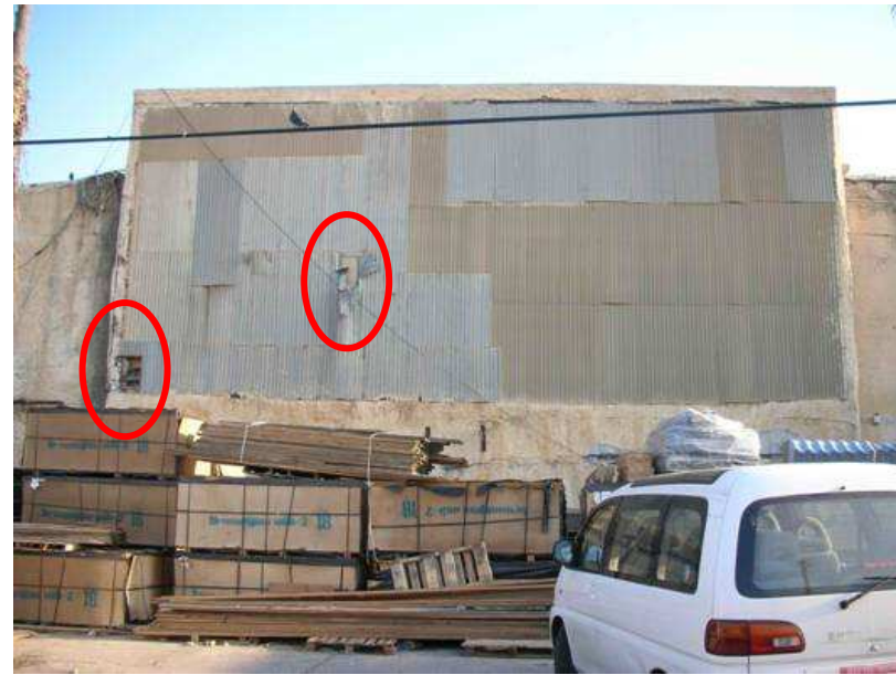
אזור תבליט הקיר מחופה בלוחות פח ניכרים פתחים דרכם חודרות יונים לקינון בגב התבליט