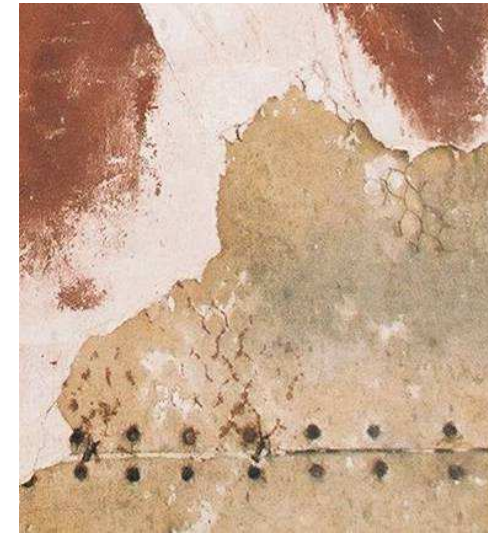
חשיפת לוחות המזוניט בבסיס התבליט