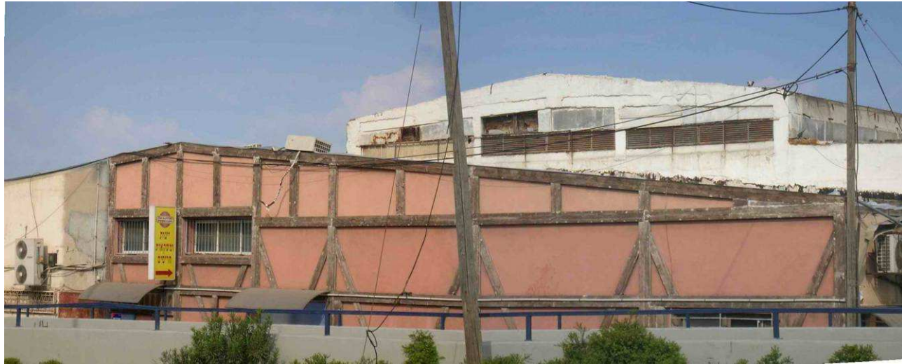
2. מבט מדרום