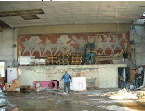
חזית צפונית מבט מפנים המבנה - התבליט במפלס מוגבה, מעל גוש בנוי בולט אל חלל המבנה