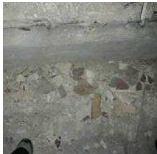
חתיכות תבליט שנשרו פזורות על הרצפה