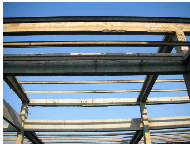
12. קונסטרוקציה גג – הביתן הצרפתי