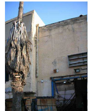
5A חיבור מסות הביתן הזר