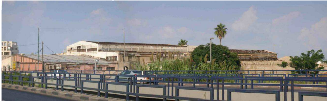
1. 'ארמון תוצרת חוץ' מבט מכיוון דרום מזרח