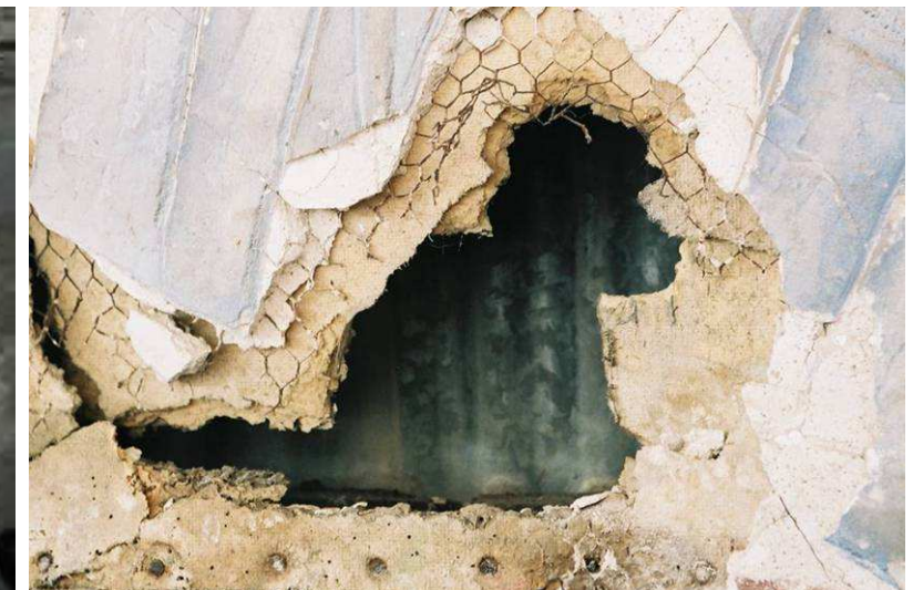
חורים וחסרים בתבליט ובתשתית עד ללוחות הפח החיצוניים