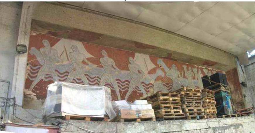
מבט פנורמי אל תבליט הקיר