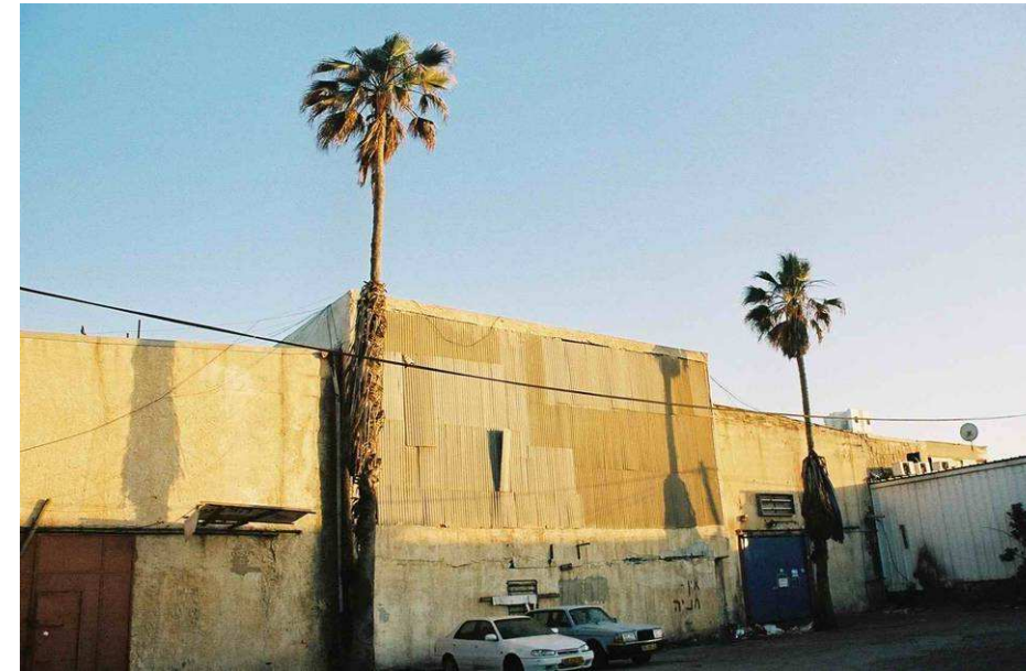
4. חזית צפונית