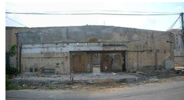
6. ביתן איטלקי - חזית צפונית