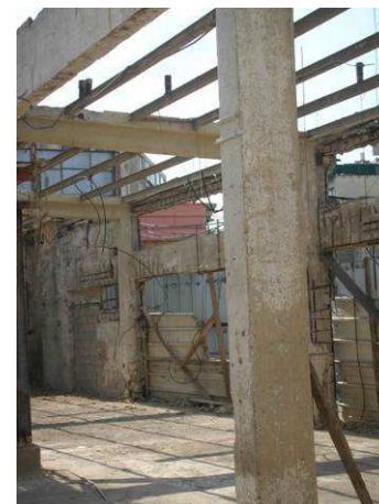
קונסטרוקציה הביתן האיטלקי