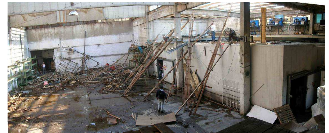
9. הביתן הזר – חלל מרכזי בעת ביצוע עבודות נובמבר 2006