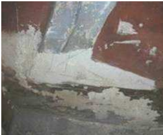
'נשירת' חלקי תבליט בולטים - כפות רגליים וכפות ידיים