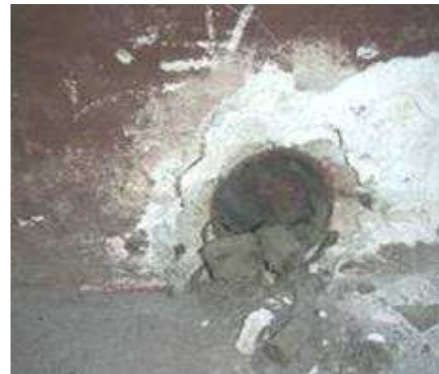
קידוחים בבסיס התבליט למעבר צנרת