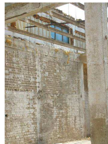
11. מחיצה פנימית בין הביתן האיטלקי לביתן הזר