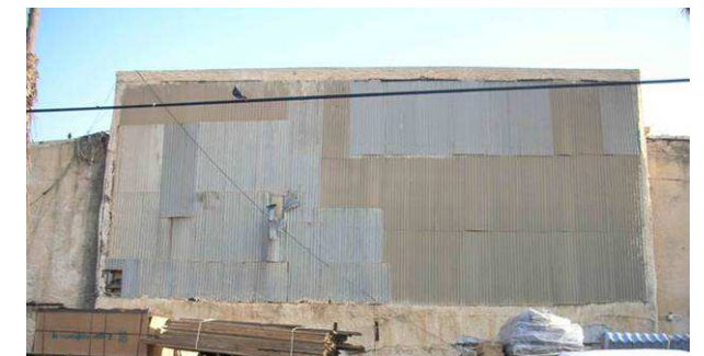
5. הביתן הזר (חלל מרכזי) - חזית צפונית