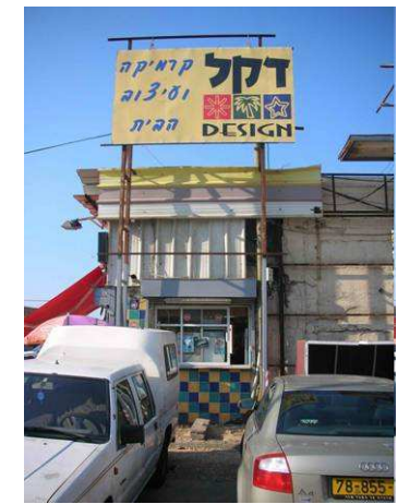
8. מבנה שער – חזית דרומית