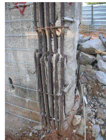
עמוד בטון ומוטות זיון ביתן צרפתי