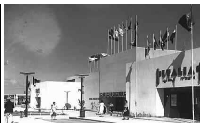
'ארמון תוצרת חוץ' הביתן האיטלקי, הביתן הזר והביתן הצרפתי 1934 13