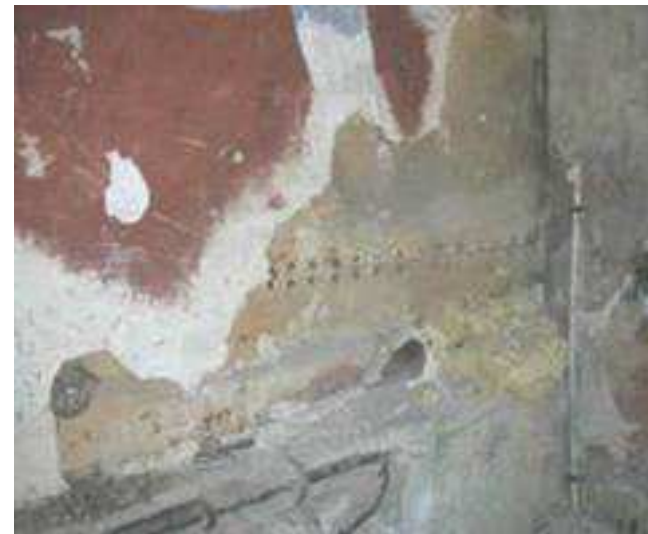
הזרקת חומר מוקצף לאיטום