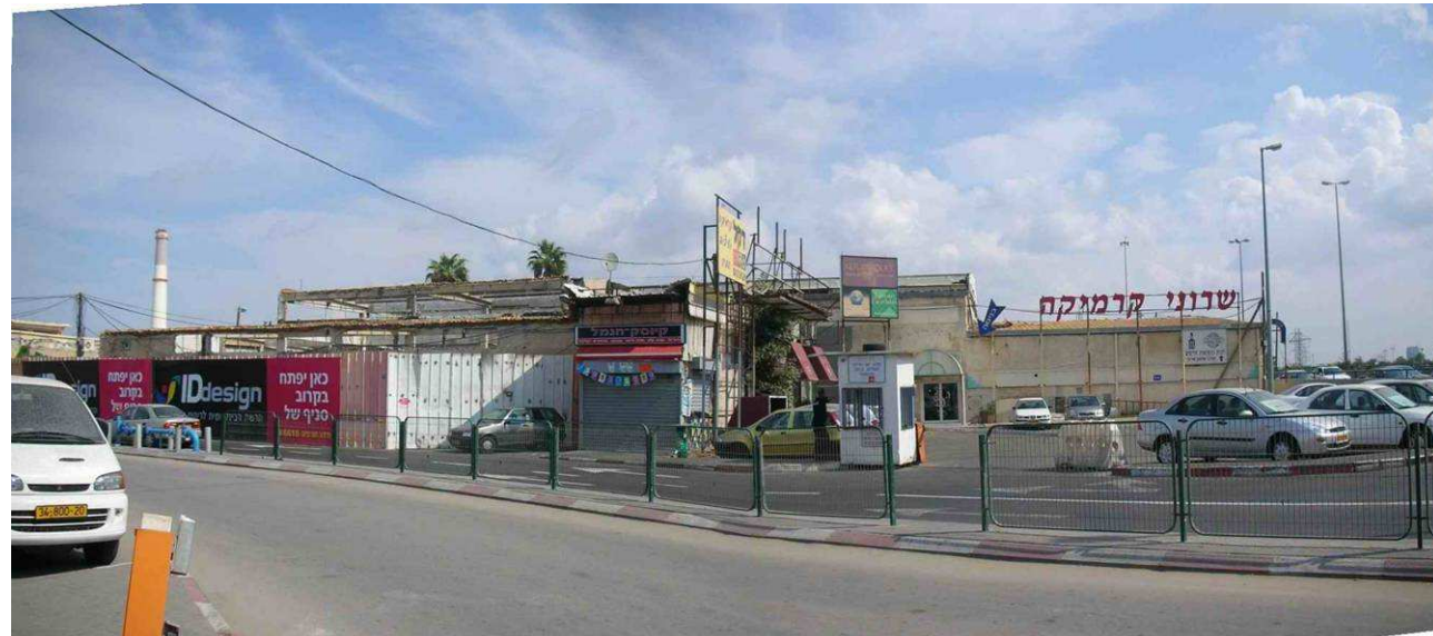
3. מבט מכיכר הכניסה הראשית - מדרום מערב